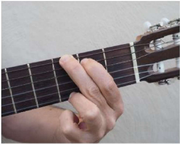
Sol / G