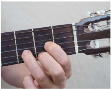
Re / D